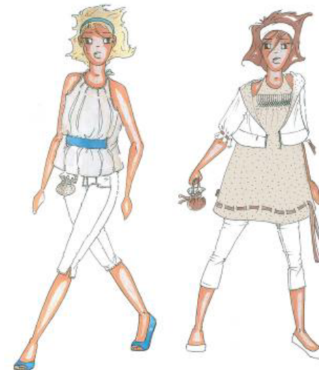
Silhouettes dessinées par Carolyn Ostyn

L'efficace simplicité des silhouettes imaginées par Caroline s'impose en